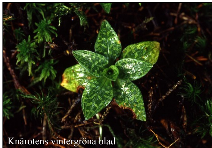
Knärotens vintergröna blad