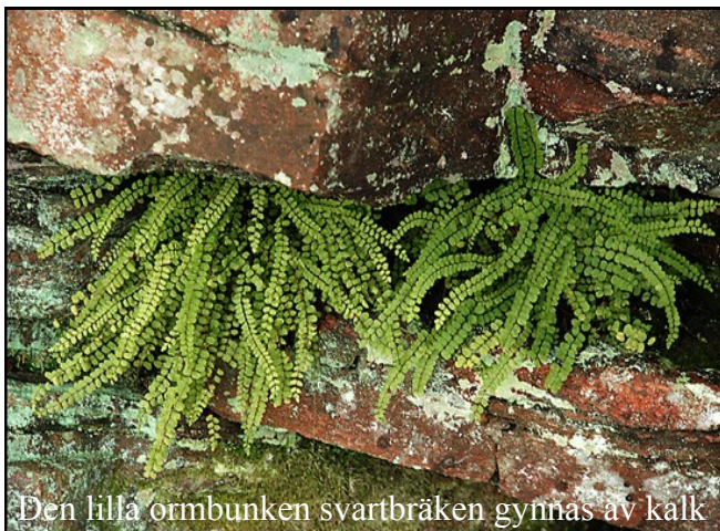
Den lilla ormbunken svartbräken gynnas av kalk

Bland fåglarna kan nämnas bivråk, ormvråk, orre, tjäder, nattskärre och stjärtmes. Det stora antalet lågor och torrakor gynnar större och mindre hackspett, gröngöling och spillkråka.