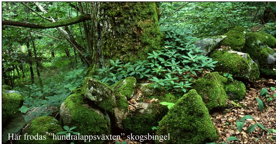
Här frodas "hundralappsväxten" skogsbingel