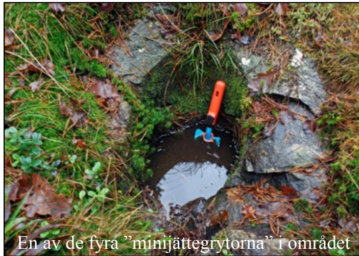
En av de fyra ”minijättegytorna” i området