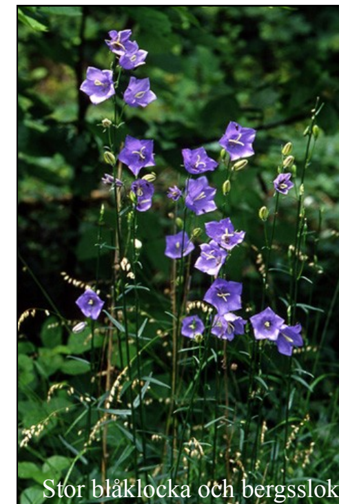
Stor blåklocka och bergsslok