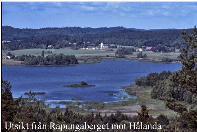
Utsikt från Rapungaberget mot Hålanda