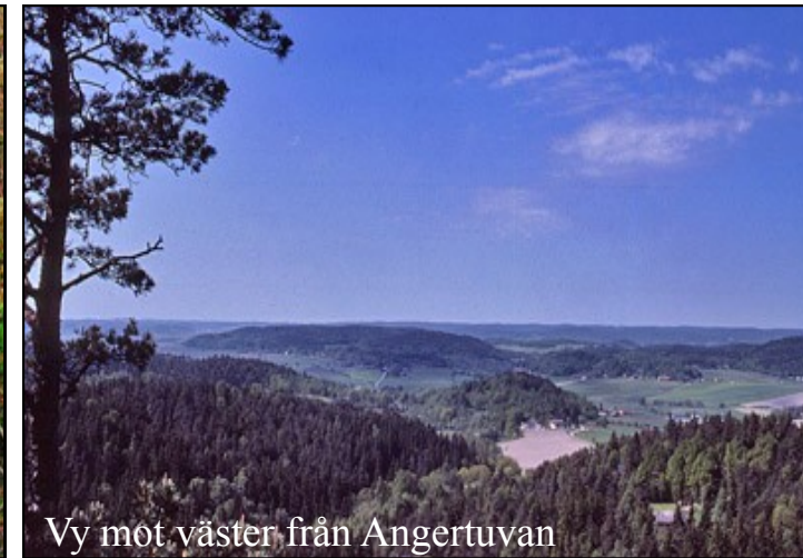
Vy mot väster från Angertuvan