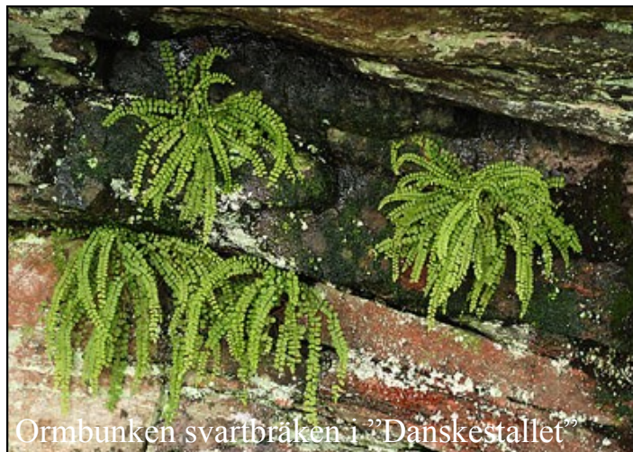
Ormbunken svartbräken i ”Danskestallet”