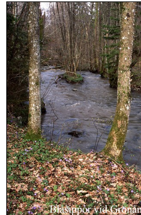
Blåsippor vid Grönån