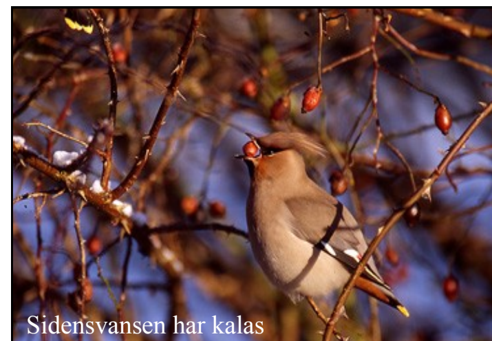
Sidensvansen har kalas