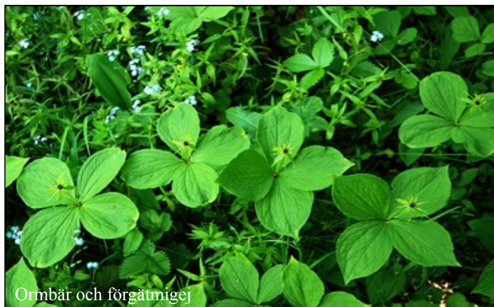
Ormbär och förgätmigej

På marken under de gamla träden växer bl.a. busk- och lundstjärnblomma, skogsbräsma, gullpudra, ormbär, strutbräken, trolldruva och blåsippan.