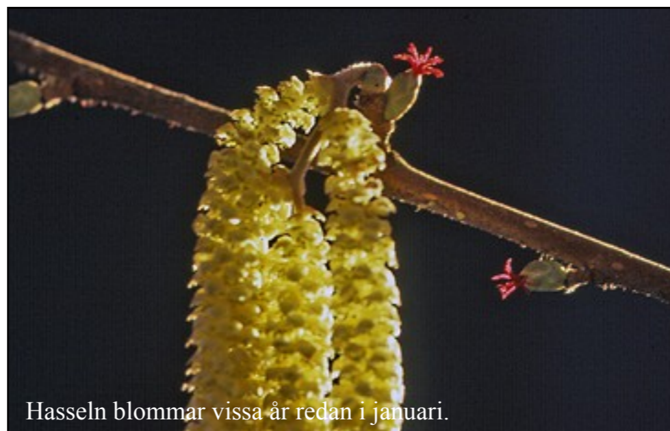
Hasseln blommar vissa år redan i januari.