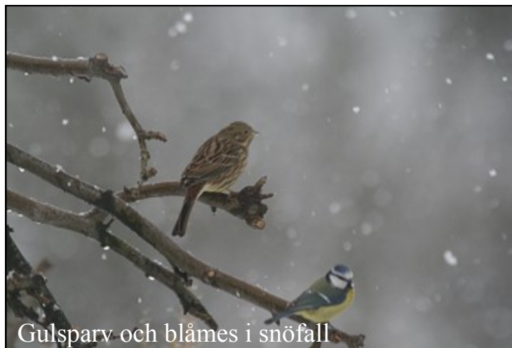
Gulspurv och blåmes i snöfall