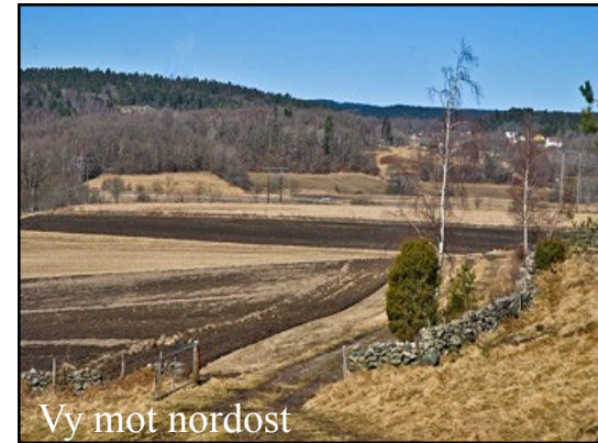
Vy mot nordost