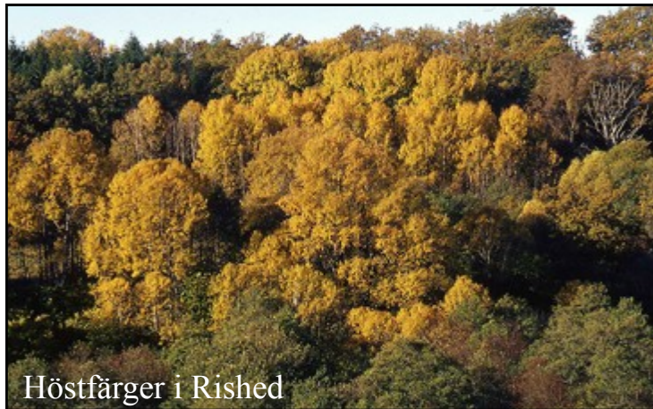
Höstfärger i Rished