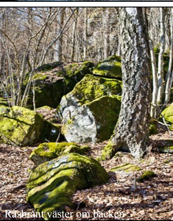
Rasbrant väster om bäcken