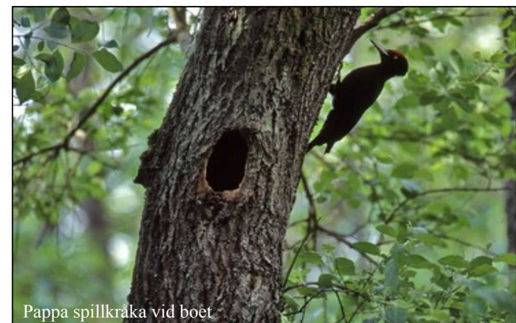
Pappa spillkråka vid boet