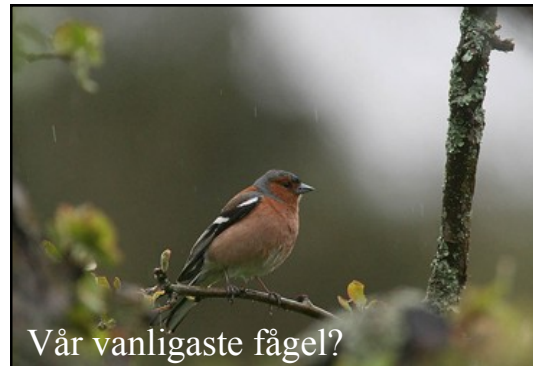
Vår vanligaste fågel?