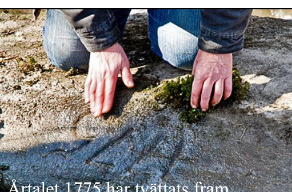
Årtalet 1775 har tvättats fram