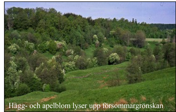
Hägg- och apelblom lyser upp försommargrönskan