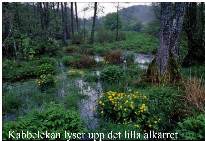
Kabbelekan lyser upp det lilla alkärret