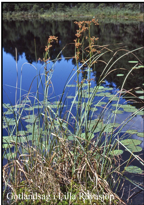
Gotlandsag i Lilla Rävasjön

Skrönan om "Skädden" faller också inom ramen för kultur. Nu ska man veta att historier från Risvedentrakten är en blandning av sanning och fantasi, där sanningen har övervikt! I "Skäddeboa" bodde tidvis den beryktade småtjuven "Skädden". Landsfiskal Gädde jagade ofta "Skädda". Vid ett tillfälle kom han till "Skäddeboa". Skädden hoppade då ut på en sten i Kvarnsjön och ropade: "Det är dåligt av en Gädda att inte kunna fånga en Skädda!" I Skäddeboa, som är en idyllisk plats, kan man med lite fantasi finna spåren av Skäddens boning.