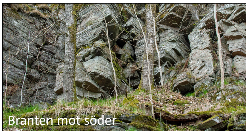
Branten mot söder