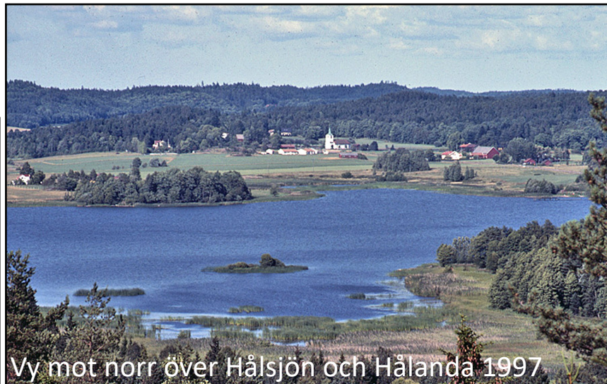
Vy mot norr över Hålsjön och Hålanda 1997

Rapungabergets södra utsikt är magnifik, så man får lön för mödan efter den branta stigningen på den något otydliga stigen upp till toppen.