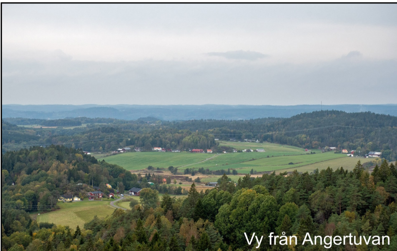
Vy från Angertuvan