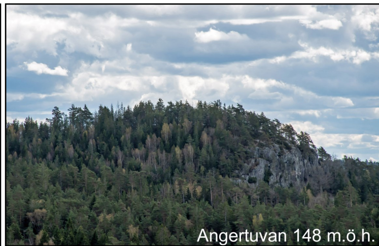
Angertuvan 148 m.ö.h.