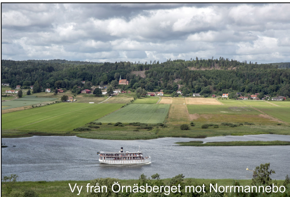
Vy från Örnäsberget mot Norrmannebo

Fornborg, ca 210x150 m (ÖMÖ-TSV) belägen på ett högt, mot V och S brant stupande berg och begränsad av stup i VS och NO, bergssluttning med vall i NV, vallar på kortare partier i Ö samt sluttning utan synlig vall på ca 40 m i SO. Vallarna i NV är 38 m l, 2-4 m br samt 0,2-0,5 m h. Den är uppbyggd av 0,3-0,6 m st, ofta skarpkantade stenar. Två vallstumpar i klyftor i N och Ö är 7-8 m l, 2-4 m br och 0,3-0,6 m h, bestående av 0,4-1 m st. stenar och block. På en sträcka i SO är en 20 m l, 2-3 m br och 0,2-0,3 m h vall av 0,2-0,5 m st. stenar. Den senare vallarna till stor del nedrasad, delvis även den i NV. Det är anmärkningsvärt, att vall saknas på den minst branta sluttningen i SO. De klyftor som finns i V är däremot mycket branta, delvis uppfyllda med block och troligen lätt försvarad från bergskränet. Vallarna måste anses ovanligt oansenligt för en fornborg, men kan svårigen antas ha haft annan funktion. Berget är kallt och bevuxet med buskar. Enligt tradition i orten skall på berget närmast älven ha funnits en borg, "som förstördes, då man tog sten till Bohus fästning".