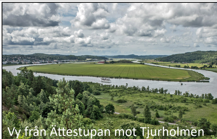
Vy från Ättestupan mot Tjurholmen

Fornborg, ca 210x150 m (ÖMÖ-TSV) belägen på ett högt, mot V och S brant stupande berg och begränsad av stup i VS och NO, bergssluttning med vall i NV, vallar på kortare partier i Ö samt sluttning utan synlig vall på ca 40 m i SO. Vallarna i NV är 38 m l, 2-4 m br samt 0,2-0,5 m h. Den är uppbyggd av 0,3-0,6 m st, ofta skarpkantade stenar. Två vallstumpar i klyftor i N och Ö är 7-8 m l, 2-4 m br och 0,3-0,6 m h, bestående av 0,4-1 m st. stenar och block. På en sträcka i SO är en 20 m l, 2-3 m br och 0,2-0,3 m h vall av 0,2-0,5 m st. stenar. Den senare vallarna till stor del nedrasad, delvis även den i NV. Det är anmärkningsvärt, att vall saknas på den minst branta sluttningen i SO. De klyftor som finns i V är däremot mycket branta, delvis uppfyllda med block och troligen lätt försvarad från bergskränet. Vallarna måste anses ovanligt oansenligt för en fornborg, men kan svårigen antas ha haft annan funktion. Berget är kallt och bevuxet med buskar. Enligt tradition i orten skall på berget närmast älven ha funnits en borg, "som förstördes, då man tog sten till Bohus fästning".