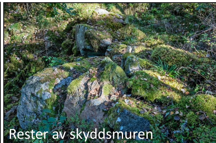
Rester av skyddsmuren