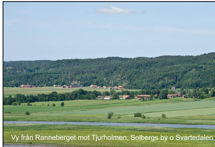
Vy från Ranneberget mot Tjurholmen, Solbergs by o Svartedalen