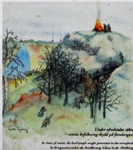
Under ofredstider sökte ärens befolkning skydd på fornborgen. In times of unrest, the local people sought protection in the stronghold. In Kriegszeiten suchte die Bevölkerung Schutz in der Fleckburg.

Rannebergets fornborg användes troligtvis under mer tillfälliga perioder, då det inte finns någon tillgång till vatten uppe på berget, däremot finns det en källa som kan ha använts nedanför berget.