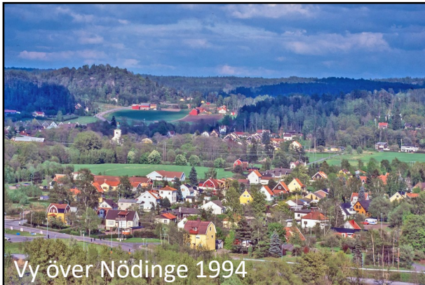
Vy över Nödinge 1994

Mareberget ligger i Kungälv kommun, men har tagits med här, eftersom utsikten härifrån vetter mot Ale. En märkt stig leder från parkeringen och upp till utsikten. Fornborgens gamla skyddsmurar syns tydligt på flera ställen. Dessa murar skall ej förväxlas med den fina gårdsgård som slingrar sig runt foten av berget. En triangelpunkt finns inhuggen i berget vid utsikten. I det branta berget ner mot älven växer flera kalkgynnade växter.