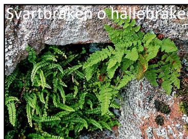
Svartbräken o hallebräken

Mareberget ligger i Kungälv kommun, men har tagits med här, eftersom utsikten härifrån vetter mot Ale. En märkt stig leder från parkeringen och upp till utsikten. Fornborgens gamla skyddsmurar syns tydligt på flera ställen. Dessa murar skall ej förväxlas med den fina gårdsgård som slingrar sig runt foten av berget. En triangelpunkt finns inhuggen i berget vid utsikten. I det branta berget ner mot älven växer flera kalkgynnade växter.