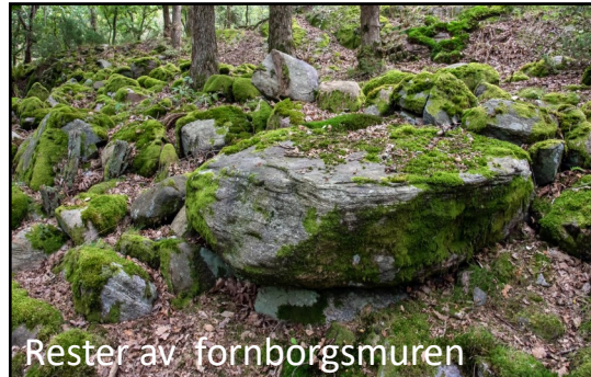
Rester av fornborgsmuren