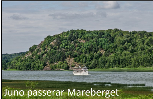
Juno passerar Mareberget