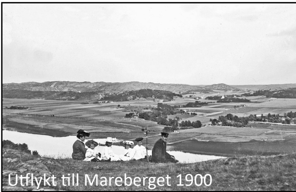
Utflykt till Mareberget 1900