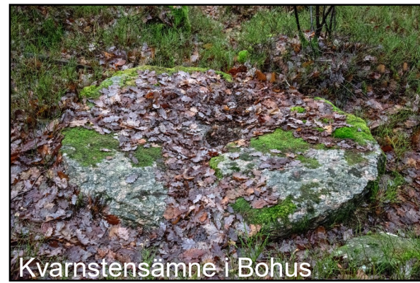
Kvarnstensämne i Bohus