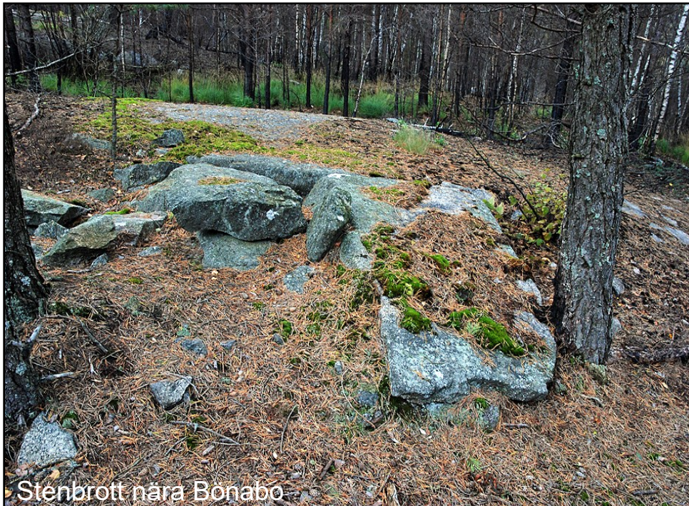
Stenbrott nära Bönabo