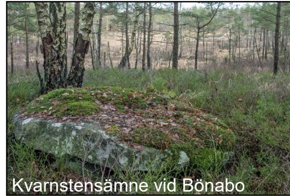
Kvarnstensämne vid Bönabo