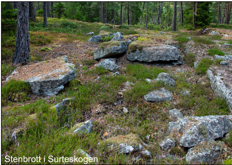
Stenbrott i Surteskogen

I våra marker finner man ofta små stenbrott, där det brutits sten till husgrunder, broar, spisfundament, kvarnstenar m.m. De användbara stenarna fraktades iväg till kvarnplatsen och de misslyckade ligger kvar. De kasserade kvarnstenarna har ibland bara ett markerat hål, men också färdighugget hål. Äldre stenhuggare och mjölnare påstod att man högg ut hålet först, för att minska spänningen i stenen, så att den inte sprack så lätt.