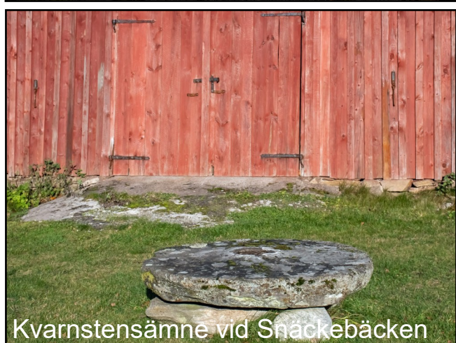
Kvarnstensämne vid Snäckebäcken