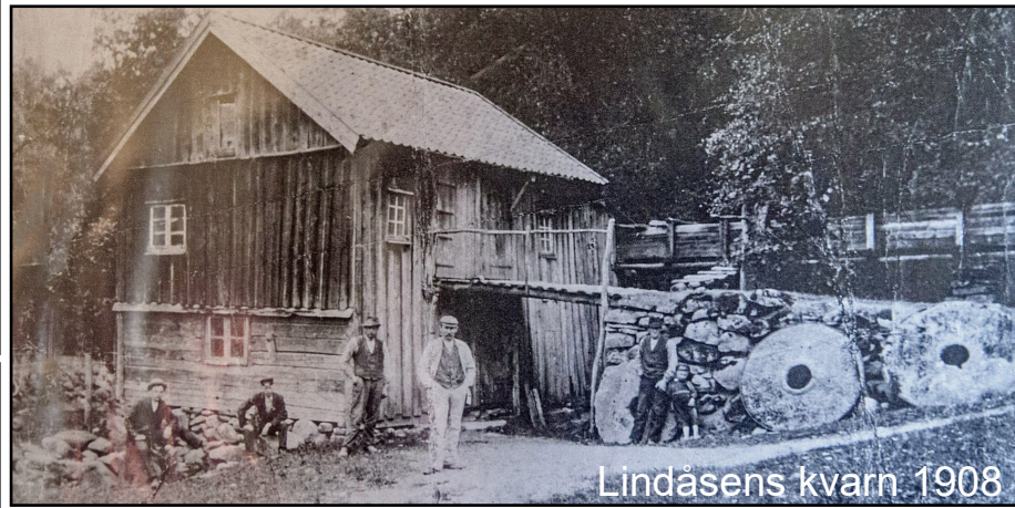
Lindåsens kvarn 1908