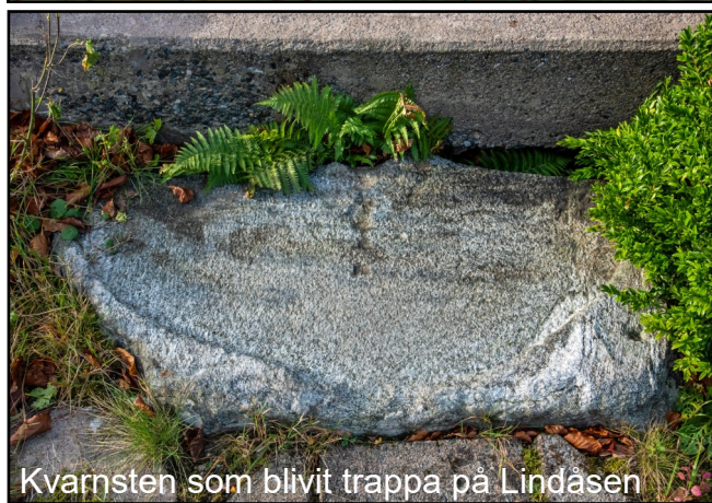
Kvarnsten som blivit trappa på Lindåsen