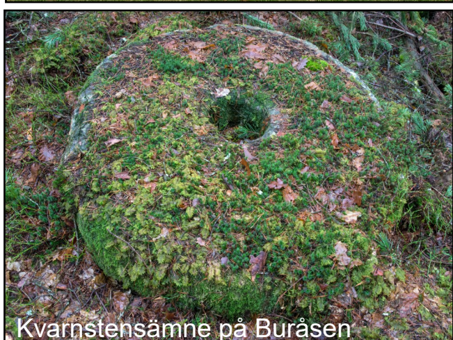
Kvarnstensämne på Buråsen