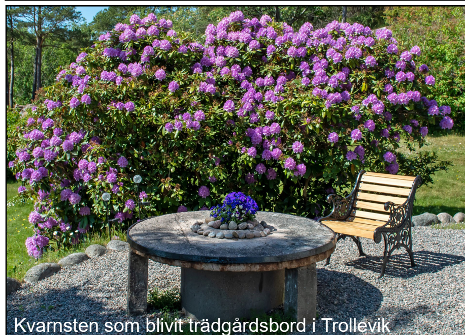
Kvarnsten som blivit trädgårdsbord i Trollevik