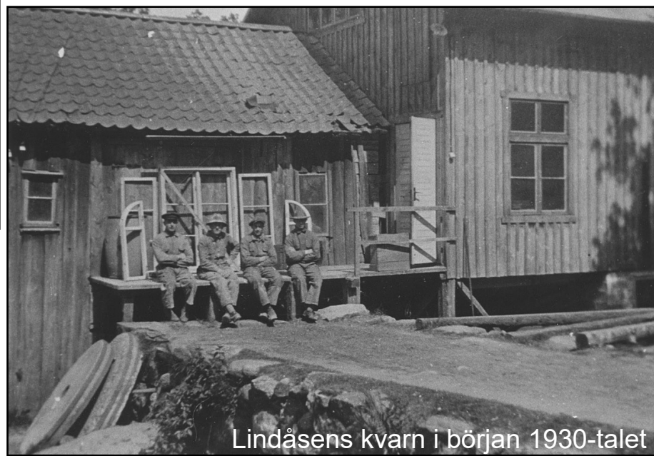
Lindåsens kvarn i början 1930-talet