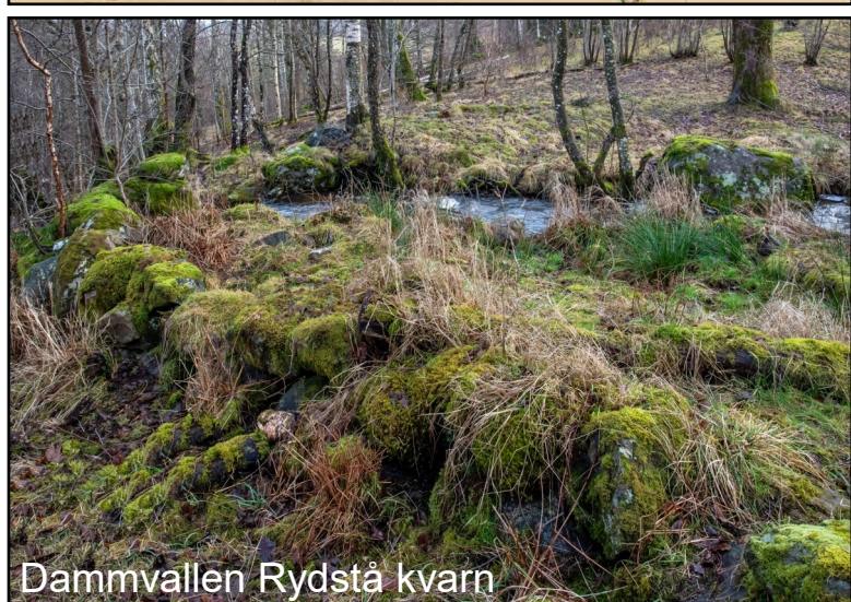
Dammvallen Rydstå kvarn