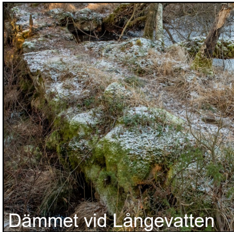
Dämmet vid Långevatten