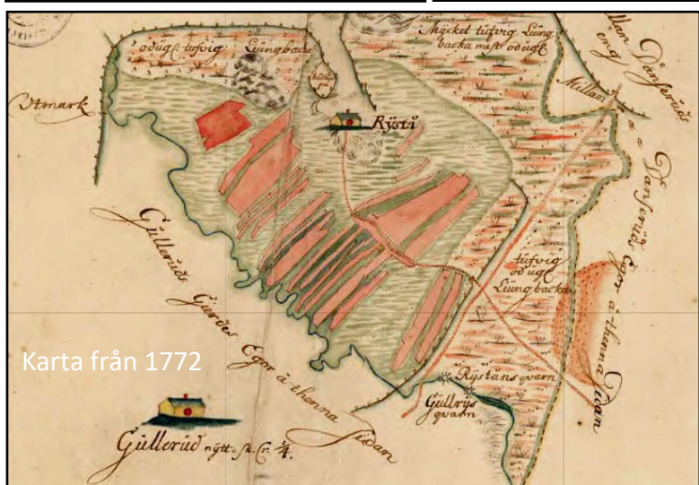
Karta från 1772