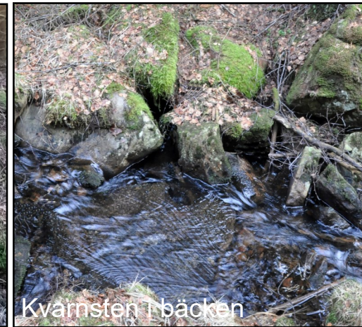
Kvarnsten i bäcken