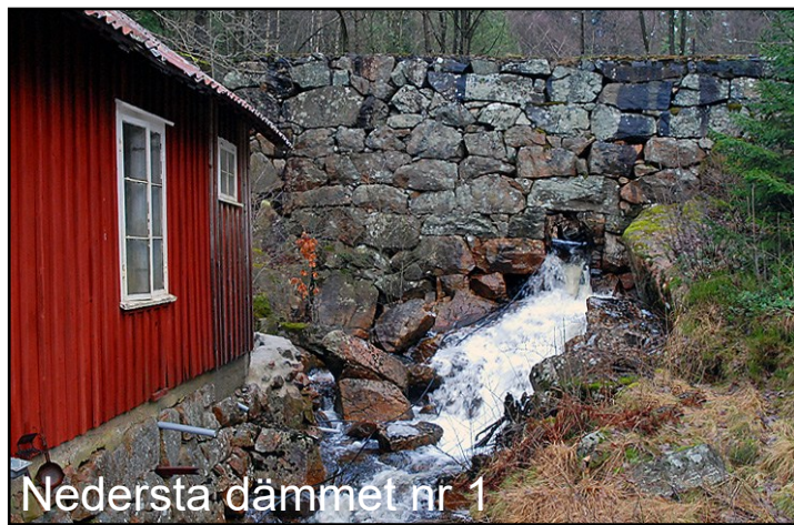
Nedersta dämme nr 1