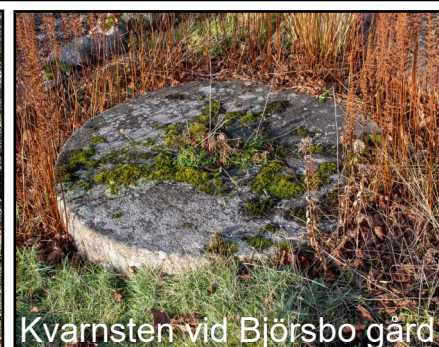
Kvarnsten vid Björso gård