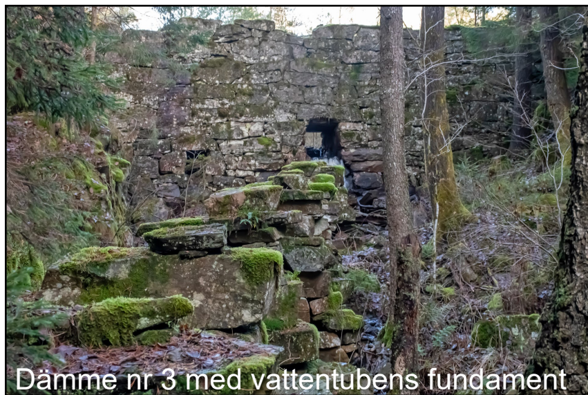
Dämme nr 3 med vattentubens fundament