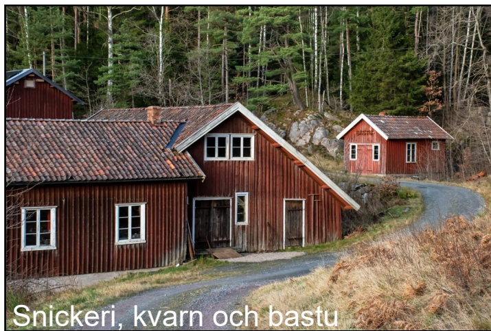
Snickeri, kvarn och bastu