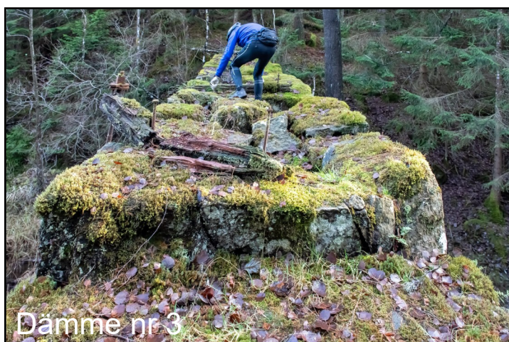
Dämme nr 3