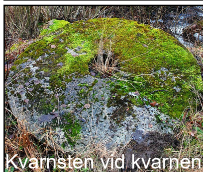
Kvarnsten vid kvarnen