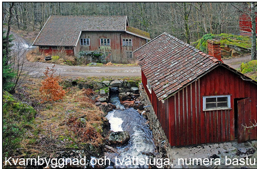
Kvarnbyggnad och tvättstuga, numera bastu