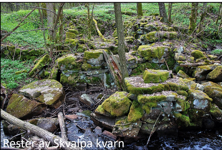
Rester av Skvalpa kvarn