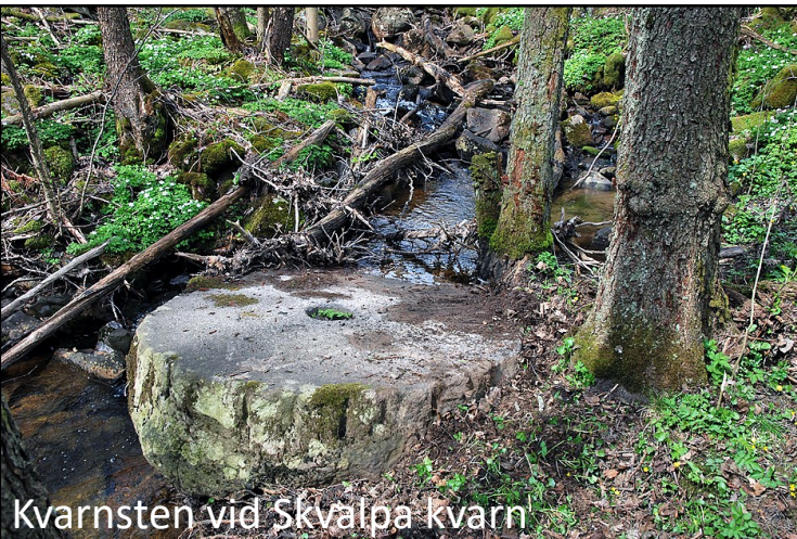
Kvarnsten vid Skvalpa kvarn