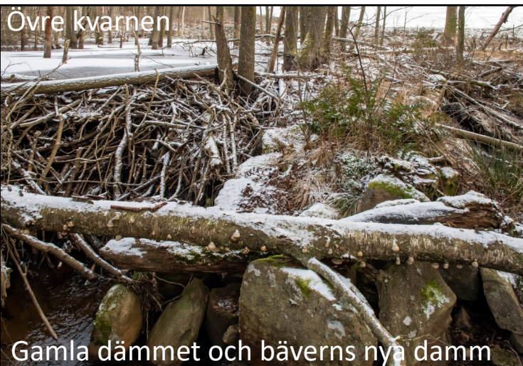
Gamla dämnet och bäverns nya damm