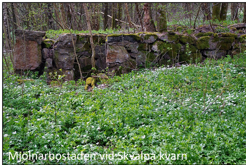
Mjölnarbostaden vid Skvalpa kvarn