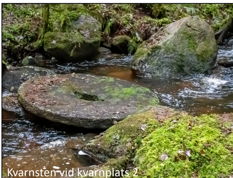
Kvarnsten vid kvarnplats 2