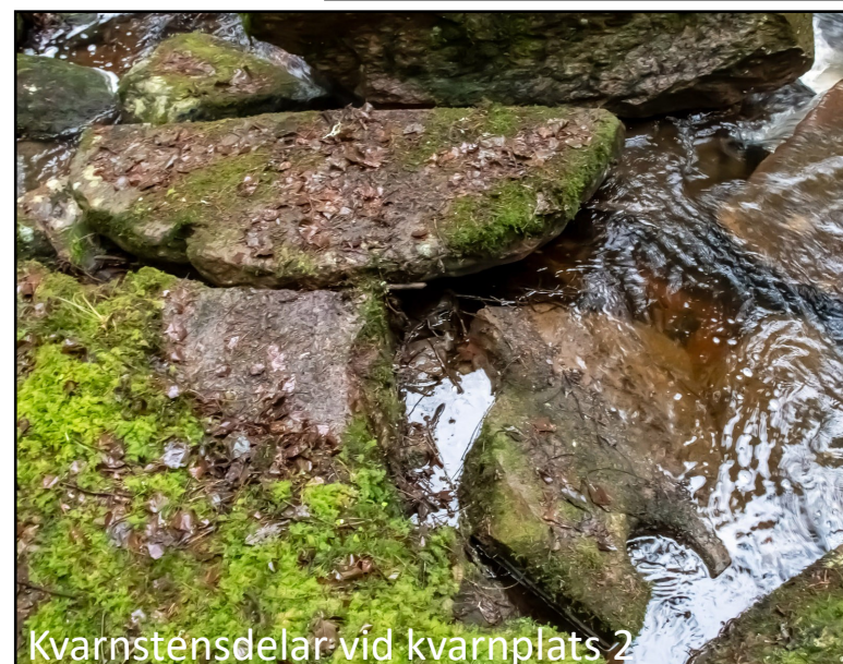
Kvarnstensdelar vid kvarnplats 2