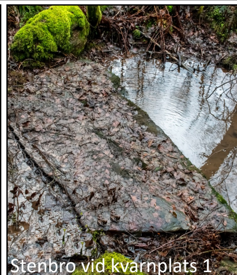
Stenbro vid kvarnplats 1