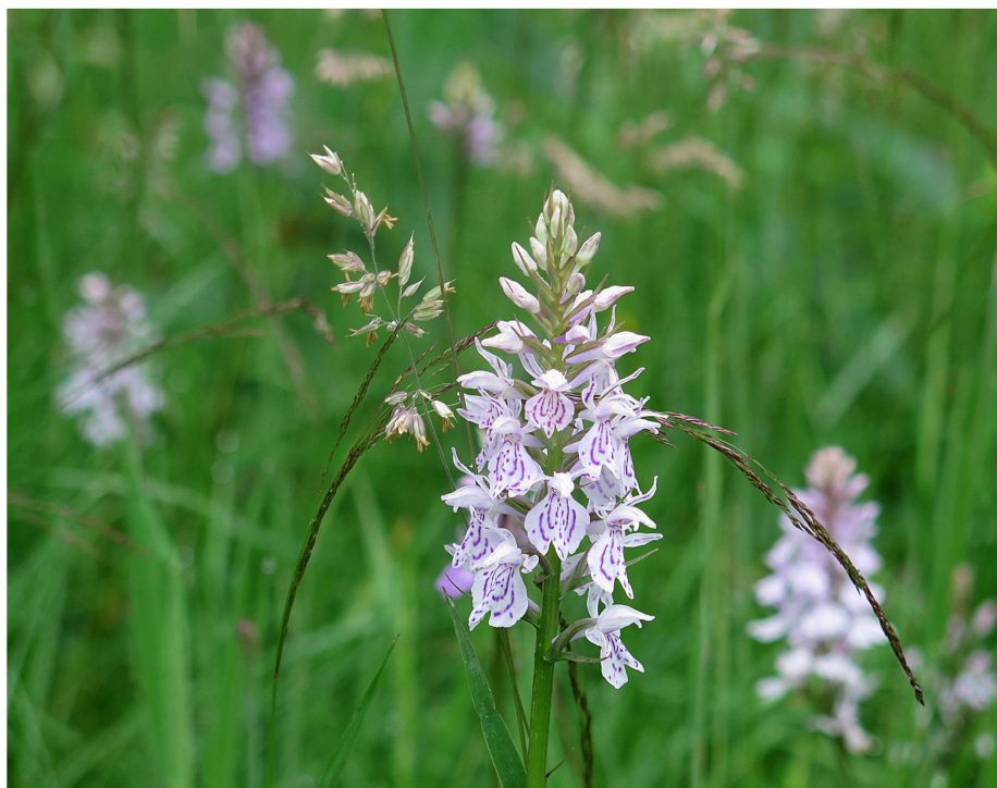
Jungfru Marie nycklar