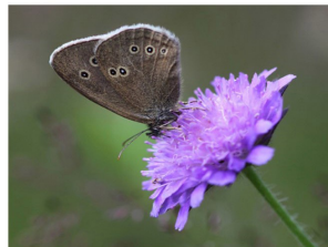
Luktgräsfjäril på äkervädd