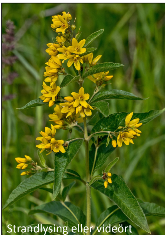
Strandlysing eller videört