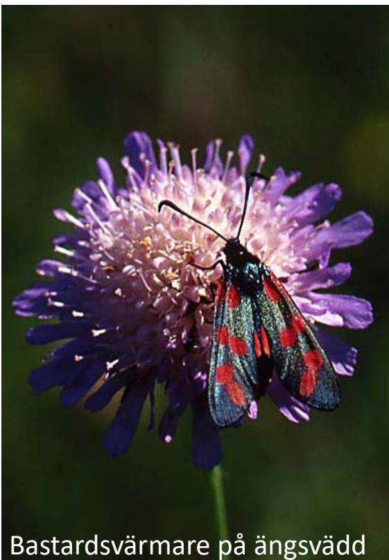
Bastardsvärmare på ängsvädd