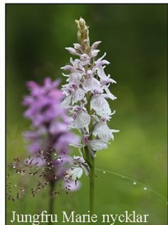
Jungfru Marie nycklar

På naturstigen i Vinningsbodalar vandrar man genom en av Ale kommuns bäst bevarade ädellövskogar med alm, ask, bok, ek, lind, lönn och hassel. På ena sidan slingrar sig Almekärrsbäcken i en djup ravin med sandbankar, forsar och lugna strömsträckor. På andra sidan reser sig en brant urbergsvägg.