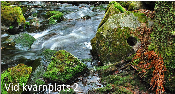
Vid kvarnplats 2

BÖRSAGÅRDEN OCH PIGEGÅRDEN DREV HÄR EN LITEN (FOTKVARN) SKVALTKVARN BELÄGEN PÅ (SAMSKÖTT MARK) I 1697 ÅRS KVARNKOMMISSIONSPROTOKOLL VAR DEN SÅLUNDA BELAGD MED SKATTE EN HALV SKÄPPA SPANNMÅLS AVGIFT. KVARNEN KUNDE DRIVAS HÖST OCH VÅR VID STARKT VATTENFLÖDE MED 1 PAR STENAR. SJÄLVA VATTENHJULET DREVS MED ETT HORIZONTALT SKOVELHJUL. "PÅ BYGDEMÅL KALLADES DET FÖR FJÄRILAR".SOM HÖLLS IGÅNG AV DET STÖMMANDE VATTNET