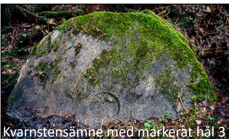
Kvarnstensämne med markerat hål 3