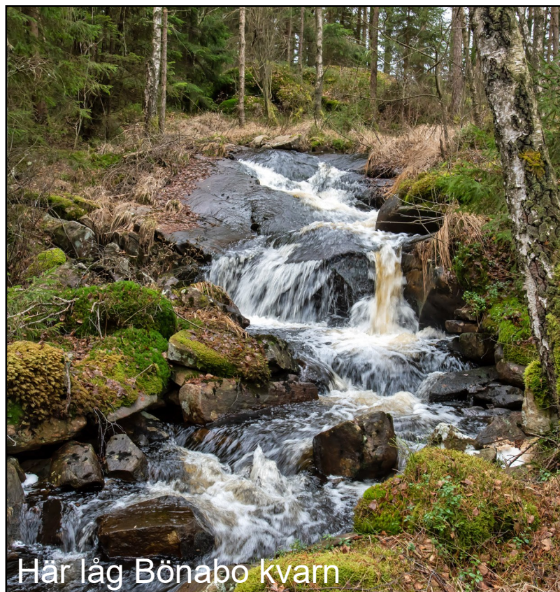
Här låg Bönabo kvarn