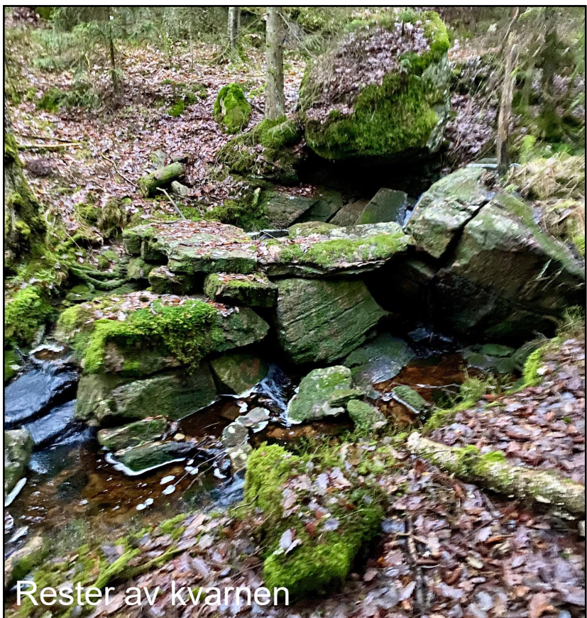
Rester av kvarnen